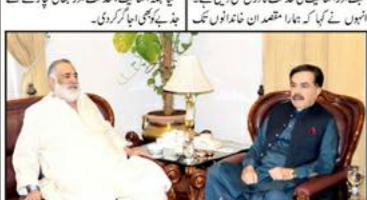
اساتذہ کی صلاحیتوں کو بڑھانے اور ان کے مسائل کو حل کرنے کے لیے کوشش کی جائے گی

آدمہ بجٹ میں سرکاری جامعات کا مالی مسئلہ حل کیا جائے، ASA بلوچستان کی تمام سرکاری جامعات کیلئے کم از کم 15 ارب روپے مختص کیے جائیں مستقل فنڈز فراہم کر کے پیٹرنز اور ملازمین کے واجبات کی ادائیگی یقینی بنائی جائے کوئٹہ (آن لائن) ایک ایگزیکٹو اجلاس میں سرکاری جامعات کے مالی مسائل کو حل کرنے کے لیے 15 ارب روپے مختص کیے جائیں۔ اس موقع پر انہوں نے کہا کہ اس مسئلے کو حل کرنے کے لیے اسرا کراچی پر گئے بچوں کا ترک تعلیم سوا لہشتاں ہے۔