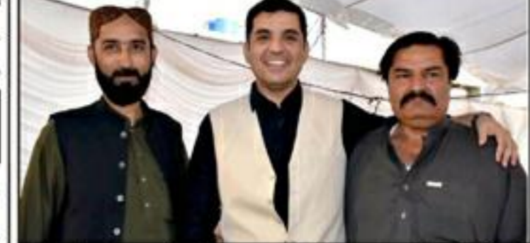
کوئٹہ (ایب پور پبلشرز) اساتذہ کی صلاحیتوں کو بڑھانے اور ان کے مسائل کو حل کرنے کے لیے کوشش کی جائے گی

اساتذہ کی صلاحیتوں کو بڑھانے اور ان کے مسائل کو حل کرنے کے لیے کوشش کی جائے گی کوئٹہ (ایب پور پبلشرز) اساتذہ کی صلاحیتوں کو بڑھانے اور ان کے مسائل کو حل کرنے کے لیے کوشش کی جائے گی۔