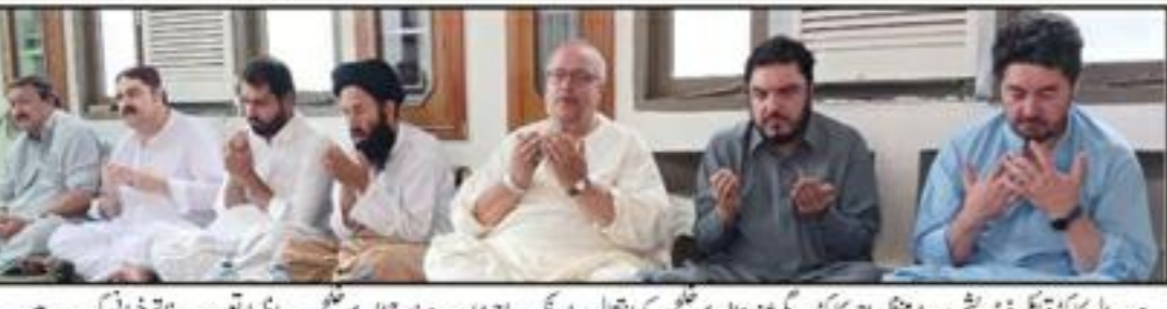
مدیر اعلیٰ کوئٹہ ڈیویڈ سیکڑی نے ایک وفد کے ہمراہ ایک اجتماع میں شرکت کی۔

عید الاضحیٰ پر کوئٹہ میں اجتماعی قربانی کا بڑا اہتمام کیا گیا بین الاقوامی تنظیم اور ستر کی کے دیانت فاؤنڈیشن کے تعاون سے 150 تیل قربان گوشت شہر کے تیرہ مختلف علاقوں میں غریب، نادار اور محتاج خاندانوں تک پہنچایا گیا کوئٹہ (ایب پور پبلشرز) عید الاضحیٰ کے موقع پر کوئٹہ میں انسانیات، اخوت اور بھائی بھائی کے لیے کوئٹہ میں 150 تیل قربان گوشت شہر کے تیرہ مختلف علاقوں میں غریب، نادار اور محتاج خاندانوں تک پہنچایا گیا۔ اس موقع پر بین الاقوامی تنظیم اور ستر کی کے دیانت فاؤنڈیشن کے تعاون سے 150 تیل قربان گوشت شہر کے تیرہ مختلف علاقوں میں غریب، نادار اور محتاج خاندانوں تک پہنچایا گیا۔