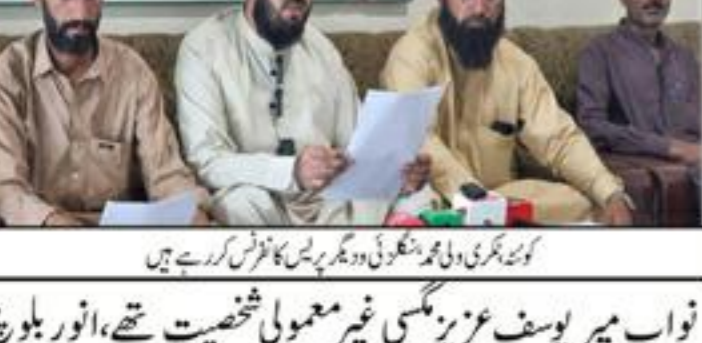
اساتذہ کی صلاحیتوں کو بڑھانے اور ان کے مسائل کو حل کرنے کے لیے کوشش کی جائے گی

اساتذہ کی صلاحیتوں کو بڑھانے اور ان کے مسائل کو حل کرنے کے لیے کوشش کی جائے گی کوئٹہ (ایب پور پبلشرز) اساتذہ کی صلاحیتوں کو بڑھانے اور ان کے مسائل کو حل کرنے کے لیے کوشش کی جائے گی۔