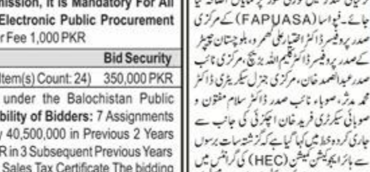
اساتذہ کی صلاحیتوں کو بڑھانے اور ان کے مسائل کو حل کرنے کے لیے کوشش کی جائے گی

اساتذہ کی صلاحیتوں کو بڑھانے اور ان کے مسائل کو حل کرنے کے لیے کوشش کی جائے گی کوئٹہ (ایب پور پبلشرز) اساتذہ کی صلاحیتوں کو بڑھانے اور ان کے مسائل کو حل کرنے کے لیے کوشش کی جائے گی۔