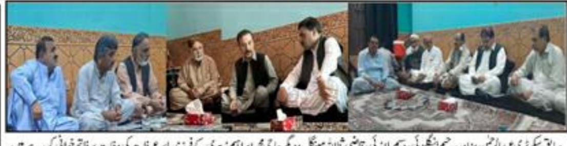
سابق نگران تعلیم و تربیت اور سربراہ تعلیم سید علی محمد شاہ نے ایک وفد کے ہمراہ ایک اجتماع میں شرکت کی۔

اسرا کراچی پر گئے بچوں کا ترک تعلیم سوا لہشتاں ہے، کامران خان 1 سال میں 350 طلباء کا سکول چھوڑنے کی وجوہات کی شفاف تحقیقات کی جائیں کوئٹہ (آن لائن) آل بلوچستان سرکاری اسکول بورڈ کے سربراہ سید علی محمد شاہ نے وزیر اعلیٰ شہباز بھٹو کی زیر اہمیت بلوچستان بکری ڈیوڈ سیکڑی اور دیگر نگران تعلیم کے ساتھ ایک ملاقات کی۔ اس موقع پر انہوں نے کہا کہ بلوچستان میں تعلیم کے شعبے کو ترقی دینے کے لیے اسرا کراچی پر گئے بچوں کا ترک تعلیم سوا لہشتاں ہے۔ انہوں نے کہا کہ اس مسئلے کو حل کرنے کے لیے اسرا کراچی پر گئے بچوں کی شناخت کی جائے اور ان کے تعلیمی مسائل کو حل کیا جائے۔ انہوں نے کہا کہ اسرا کراچی پر گئے بچوں کی شناخت کی جائے اور ان کے تعلیمی مسائل کو حل کیا جائے۔