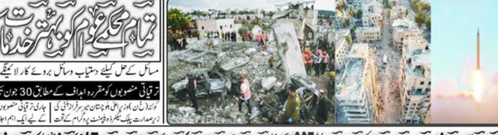
فرضائی حملوں میں شہادتوں کی تعداد 1348 تک پہنچ گئی، لبنان میں اسرائیل کی وحشیانہ بمباری جاری شہداء کی تعداد 687 ہوئی...