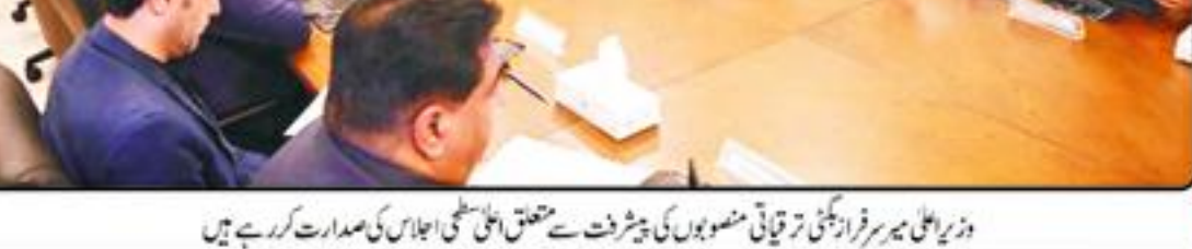
وزیر اعلیٰ میر فرزانہ نے ترقیاتی منصوبوں کی پیشرفت سے متعلق اعلیٰ اجلاس کی صدارت کر رہے ہیں...