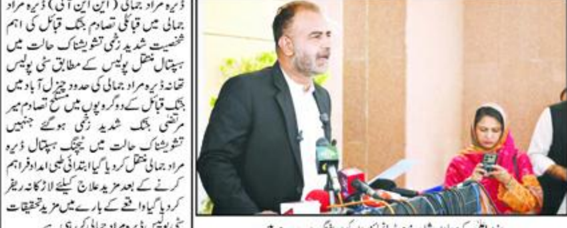
ایگزیکٹو ڈائریکٹرز کو ملٹی نیشنل ایسٹیمینٹس اور سولیا کے وفد سے ملنے کا موقع فراہم کیا۔

ایگزیکٹو ڈائریکٹرز کو ملٹی نیشنل ایسٹیمینٹس اور سولیا کے وفد سے ملنے کا موقع فراہم کیا۔ ایگزیکٹو ڈائریکٹرز کو ملٹی نیشنل ایسٹیمینٹس اور سولیا کے وفد سے ملنے کا موقع فراہم کیا۔