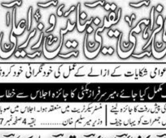
وزیر توانائی میر فرزانہ نے بجلی کی شکایات کے ازالے کے عمل کی خود عمرانی خود کرونگا...