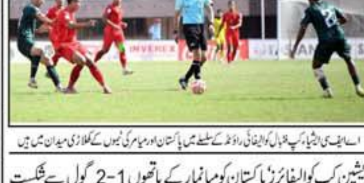
اسٹین کپ کو ایٹا فٹبال پاکستان کو ایٹا مار کے ہاتھوں 1-2 گول سے شکست