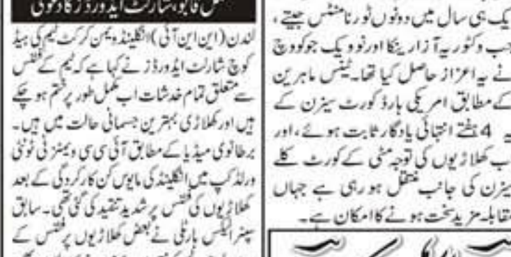
بیلاروس کی ٹینس شٹارڈ اریانا سبالیڈکا کی شاندار فارم برقرار