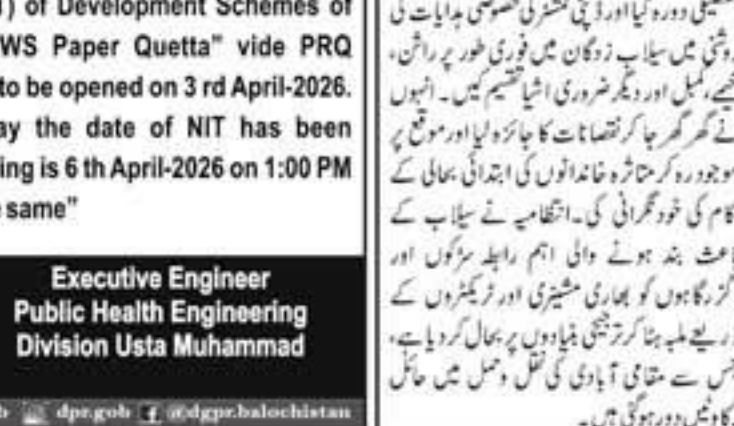
مبارک غلامانی کو گھڑ میں خسرو گیسر میں اعلیٰ وکیلینوں میں خونی مبارک