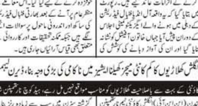
بھارتی فٹبال فیڈریشن کے صدر پر ہراسانی کا الزام، پھیل چکے گئے

اسلام آباد (آن لائن) اسٹین کپ کو ایٹا فٹبال پاکستان کو ایٹا مار کے ہاتھوں 1-2 گول سے شکست اسٹین کپ کو ایٹا فٹبال پاکستان کو ایٹا مار کے ہاتھوں 1-2 گول سے شکست