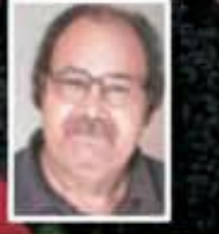
عمر فاروقی لے آؤت: دوئم شہزادہ پال