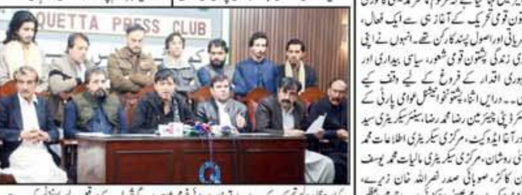
اہل غوری نے کہا کہ موجودہ حکومت بلدیاتی نمائندوں سے خوفزدہ ہے

موجودہ حکومت بلدیاتی نمائندوں سے خوفزدہ ہے، اہل غوری نے کہا کہ موجودہ حکومت بلدیاتی نمائندوں سے خوفزدہ ہے۔ اہل غوری نے کہا کہ موجودہ حکومت بلدیاتی نمائندوں سے خوفزدہ ہے۔