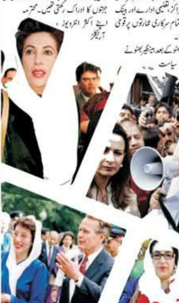
اور عروج میں تہجدی بدل کے عالمی ماحول میں قرضوں میں بیکاری پاکستانی معیشت کی بھاری بھاری کٹنگ ٹری کر کے ہونے لگی۔

بنظیر بھٹو نے اپنے والد اور مشہور وزیر اعظم ذوالفقار علی بھٹو کو اقتدار کے عروج میں سے متعلق ہونے دیکھا اور ان کی سیاسی اہمیت کو سمجھا۔ انہوں نے اپنی زندگی میں ان کی سیاسی اہمیت کو سمجھا۔