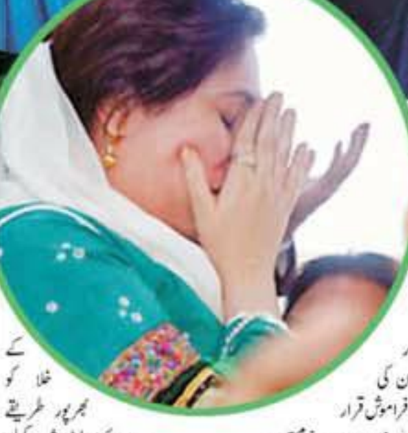
اور نمایاں شہادتیں اپنے عروج بیانات میں کی خدمات جمہوریت کیلئے ان کی جدوجہد کو ناقابل فراموش قرار

بنظیر بھٹو کے بارے میں اپنے ایک انٹرویو میں کہا تھا کہ کٹر مہم جوئی کا عالمی سطح پر ایک مقام ہے۔ وہ قوم کیلئے ایک سرمایہ ہیں۔ ملک کو ان کی شہادتیت سے فائدہ اٹھانا چاہیے۔ قومی معاملات ہوں یا خارجی تعلقات، کٹر مہم جوئی سے وہ کبھی نہیں کہ امریکہ میں اچھا نہیں سمجھے ہیں اور برائیاں بھی، تاہم ان کی اچھائی کی تعریف کرتی چاہیے اور برائی پر تنقید۔ کٹر مہم جوئی بنظیر بھٹو پاکستان چیلنجر پارٹی کی تاحیات چیئر پرسن تھیں۔ ان کی شہادتیت کی تائید پارٹی نے 40 روزہ سولگ کا اعلان کیا۔ ملک بھر کی تاجر تنظیموں نے بھی 3 روزہ سولگ کا اعلان کیا اور اپنے ایک بیان میں کہا کہ ملک میں تمام تجارتی مراکز 3 روزہ سولگ کا اعلان کیا۔ تنظیموں نے کٹر مہم جوئی سے گہرے دکھ اور غم کا اظہار کیا اور پندرہ روزہ سولگ کا اعلان کیا۔ حکومتی سطح پر بھی 3 روزہ سولگ کا اعلان کیا گیا۔ اس موقع پر صدر مشرف نے کہا کہ تمام سرکاری دفاتر، کاروباری مراکز، تعلیمی ادارے اور بینک بند رہیں گے۔ اور تمام سرکاری عمارتوں پر قومی پرچم لہرائیں گے۔