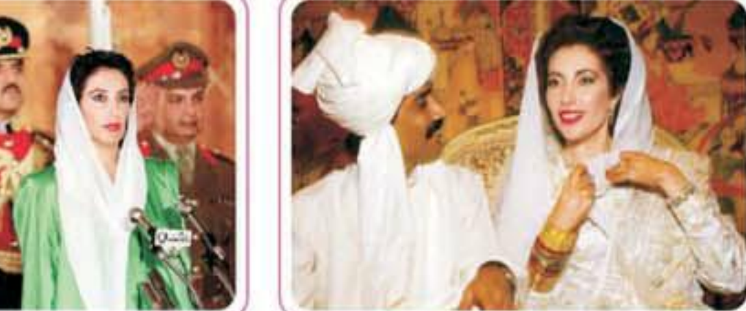
بنظیر بھٹو نے اپنے والد اور مشہور وزیر اعظم ذوالفقار علی بھٹو کو اقتدار کے عروج میں سے متعلق ہونے دیکھا اور ان کی سیاسی اہمیت کو سمجھا۔