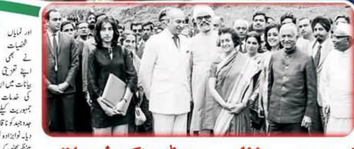
اپنی زندگی کی آسودگیوں کو ایک طرف رکھ کر اور عوام کے مفاد کے لئے اپنے جتن کی انہوں نے اہلی اور بڑے ترین کیلئے، وہ بھارت میں، وسطی بینک اور وفا شعار شریک حیات تھیں، ایک بیٹی کی حیثیت سے وہ ایسی اولاد تھیں جس پر ان کا پابند اور ماضی کا رشتہ تھا۔ وہ ڈاکٹر انیسٹریٹ کے قریب کی بیٹی تھیں جو اسلامی باگ اور تیسری دنیا کی قیادت کے لئے تھیں۔ انہوں نے پاکستان میں عوام کی سیاست کو رواج دیا اور وہ نئے عزم کے اقتدار میں ان کو شریک تیار کیا۔ انہوں نے پاکستان میں ایک نیا عزم اور نیا جوش پیدا کیا۔ انہوں نے پاکستان کی سیاست کو نیا رخ دیا اور وہ نئے عزم کے لئے تیار ہوئے۔ انہوں نے پاکستان کی سیاست کو نیا رخ دیا اور وہ نئے عزم کے لئے تیار ہوئے۔

بنظیر بھٹو کے بارے میں اپنے ایک انٹرویو میں کہا تھا کہ کٹر مہم جوئی کا عالمی سطح پر ایک مقام ہے۔ وہ قوم کیلئے ایک سرمایہ ہیں۔ ملک کو ان کی شہادتیت سے فائدہ اٹھانا چاہیے۔ قومی معاملات ہوں یا خارجی تعلقات، کٹر مہم جوئی سے وہ کبھی نہیں کہ امریکہ میں اچھا نہیں سمجھے ہیں اور برائیاں بھی، تاہم ان کی اچھائی کی تعریف کرتی چاہیے اور برائی پر تنقید۔ کٹر مہم جوئی بنظیر بھٹو پاکستان چیلنجر پارٹی کی تاحیات چیئر پرسن تھیں۔ ان کی شہادتیت کی تائید پارٹی نے 40 روزہ سولگ کا اعلان کیا۔ ملک بھر کی تاجر تنظیموں نے بھی 3 روزہ سولگ کا اعلان کیا اور اپنے ایک بیان میں کہا کہ ملک میں تمام تجارتی مراکز 3 روزہ سولگ کا اعلان کیا۔ تنظیموں نے کٹر مہم جوئی سے گہرے دکھ اور غم کا اظہار کیا اور پندرہ روزہ سولگ کا اعلان کیا۔ حکومتی سطح پر بھی 3 روزہ سولگ کا اعلان کیا گیا۔ اس موقع پر صدر مشرف نے کہا کہ تمام سرکاری دفاتر، کاروباری مراکز، تعلیمی ادارے اور بینک بند رہیں گے۔ اور تمام سرکاری عمارتوں پر قومی پرچم لہرائیں گے۔