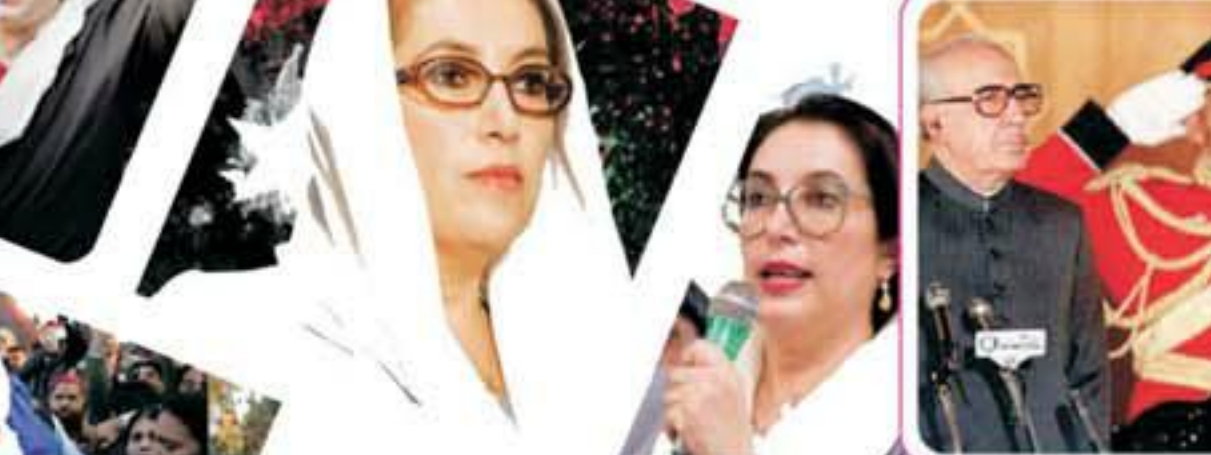
بنظیر بھٹو نے اپنے والد اور مشہور وزیر اعظم ذوالفقار علی بھٹو کو اقتدار کے عروج میں سے متعلق ہونے دیکھا اور ان کی سیاسی اہمیت کو سمجھا۔