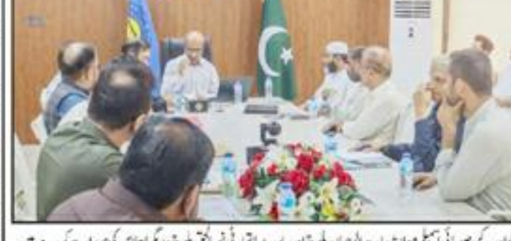
کوئٹہ میں ٹریفک جام اور غیر منظم پبلک ٹرانسپورٹ، شہری خوار ہیں۔