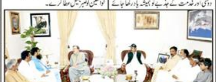
سروازادہ کو مارا جانے والا فوجی، افسانہ اور قابل خدمت ہے، اعلیٰ قیادت نے

کوئٹہ (ایس ایم ایف رپورٹر) سروازادہ کو مارا جانے والا فوجی، افسانہ اور قابل خدمت ہے۔ اعلیٰ قیادت نے کہا کہ وہ قابل خدمت ہے۔