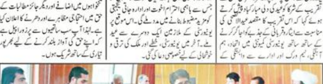
یونیورسٹی آف تربت میں عید ملن پارٹی کا انعقاد کیا گیا

یونیورسٹی آف تربت میں عید ملن پارٹی کا انعقاد کیا گیا۔ تقریب میں شرکت کرنے والے اراکین نے کہا کہ یہ پارٹی کامیاب رہی۔