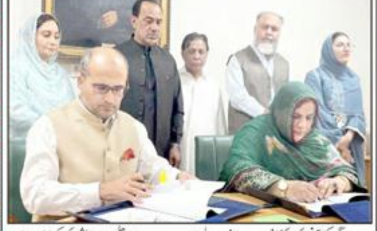
ایس ایم ایف کے چیف ایگزیکٹو آفیسر نے اودیات فروش کے متعلق اراکین کو آگاہ کیا