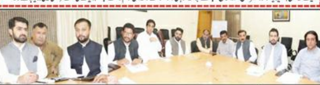
ہندو منڈی جنرل اسپتال کی تھیلیسیا اور انکھوں کی کیفیت علاج کیا جا رہا ہے