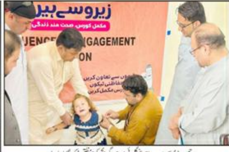
جس ڈی وی سیبیب انجمن شکرانی موجودی پٹی کو حاضری لگے گا کیا جا رہا ہے