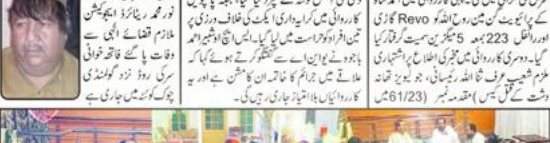
عوام کے جان و مال کا تحفظ اولین ترجیح ہے، ایس ایچ اوشیر احمد باجوہ

عوام کے جان و مال کا تحفظ اولین ترجیح ہے، ایس ایچ اوشیر احمد باجوہ نے کہا کہ یہ جان و مال کا تحفظ اولین ترجیح ہے۔