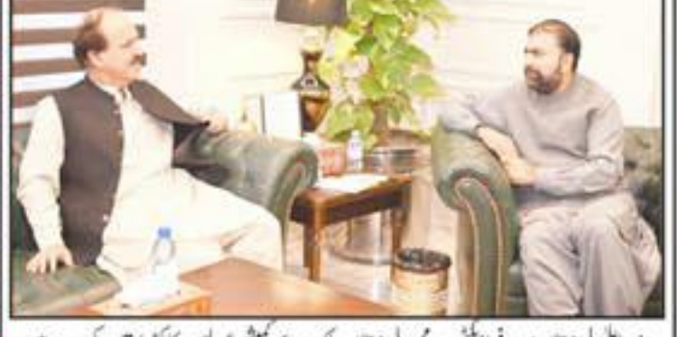
وزیر اعلیٰ بلوچستان میر فرخانی نے سیر بلوچستان پبلک سروس کمیشن کے رکنوں کو اجلاس منعقد کرنے کے لیے...