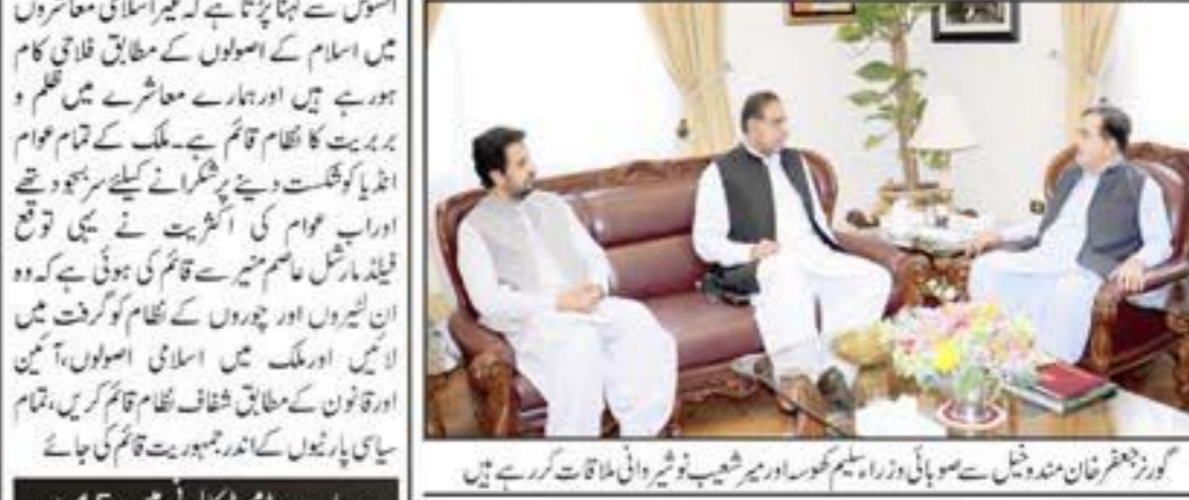
گورنر خٹگان منہ وٹیل سے صوبائی وزیر اعظم کوسر باب میں کابینہ کی وفاقی مذاقات کر رہے ہیں

اسمبلی کے ممبران، سینٹ کے ممبران اور صوبائی اسمبلی کے ممبران کو بجٹ سے پہلے ہی نواز دیا گیا اور اب ان کے دلکھتوں کیلئے بجٹ کی رقم تقسیم کی گئی ہے۔ بجٹ کے تحت ملازمین کی تنخواہیں اور سروسز میں اضافہ کیا گیا ہے۔ بجٹ میں فیڈرل ایڈمنسٹریشن اور سروسز میں اضافہ کیا گیا ہے۔ بجٹ میں فیڈرل ایڈمنسٹریشن اور سروسز میں اضافہ کیا گیا ہے۔