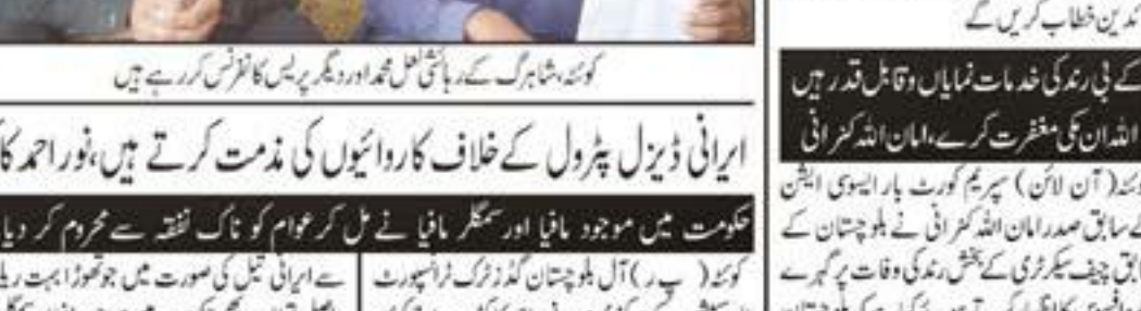
پاک افغان باڈی کے رکنوں نے ہجرت کرنے والے کاروباریوں کی روک تھام کے لیے...