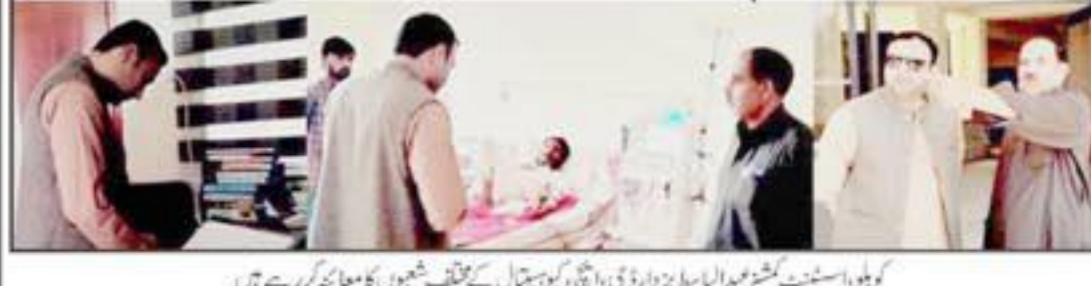
کوہلو اسسٹنٹ کمشنر ایاز طے اور ڈی ایچ او کیپٹن اے ایف ایف کے مختلف شعبوں میں معائنہ کر رہے ہیں

اور بلوچستان ایم ڈی سپرول اسٹوڈ کے اہلکاروں میں شیڈولنگ کیلئے ایف ایف ایف کی رقم تقسیم کی گئی ہے۔ بجٹ میں فیڈرل ایڈمنسٹریشن اور سروسز میں اضافہ کیا گیا ہے۔ بجٹ میں فیڈرل ایڈمنسٹریشن اور سروسز میں اضافہ کیا گیا ہے۔