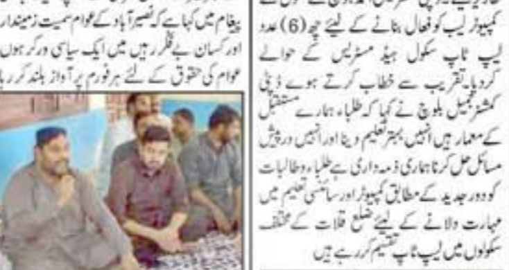
قلمرو کھیت کے کٹرکھیل ملازمین