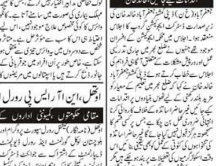
قلمرو کھیت کے کٹرکھیل ملازمین