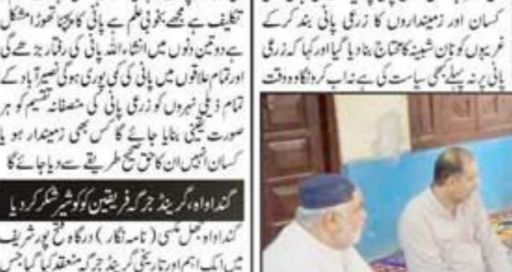
قلمرو کھیت کے کٹرکھیل ملازمین