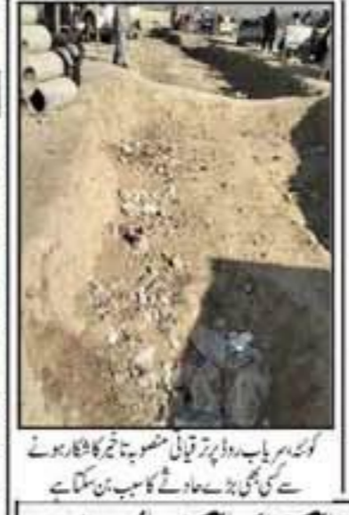
کوئٹہ میں ایک نیا منصوبہ کی بنیاد رکھی جا رہی ہے۔