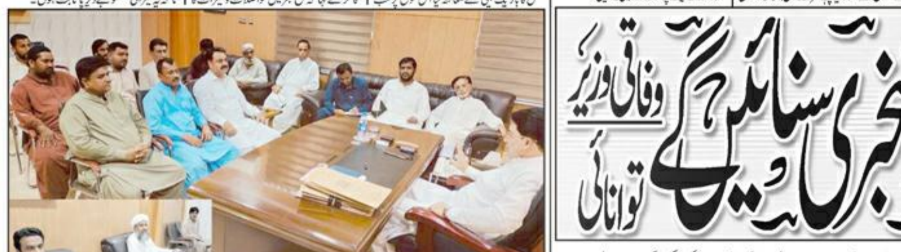
کشمیر نصیر آباد ضلع میں ترقیاتی کاموں کے لیے سیکورٹیز کی فراہمی کیلئے ایک اجلاس منعقد کیا گیا۔