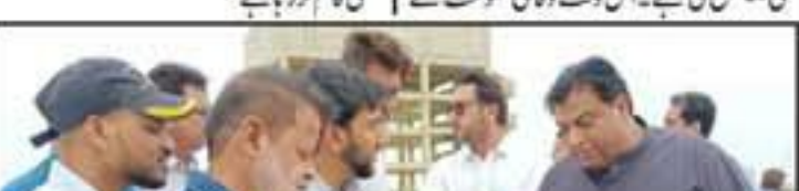
ایڈووکیٹ جنرل کی سربراہی میں ایڈووکیٹ جنرل کی سربراہی میں ایڈووکیٹ جنرل کی سربراہی میں...