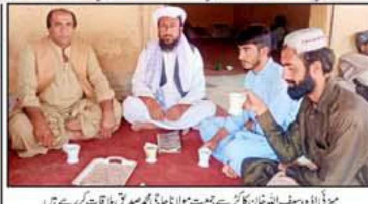
ڈیپٹی کمشنر کوہلو کا وفد کے ساتھ میٹنگ کے بعد

www.dpr.gov.pk @dpr_gob dpr_gob dgpr.balochistan