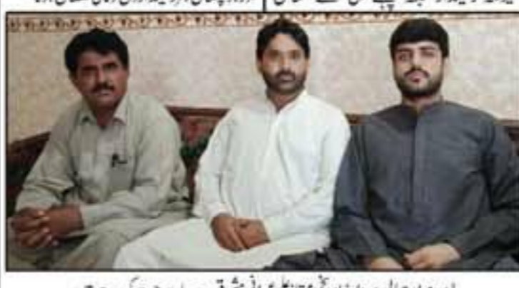
ایریمز اور برائی سروراز اور ڈیپٹی کمشنر مشرق سے بات چیت کرتے ہیں

ایران اور افغانستان سے بیاز کی درآمد سے زمینداروں کا معاشی استحصال ہے